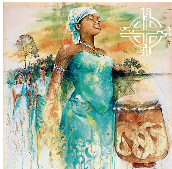
„Gran tangi gi Mama Aisa (In gratitude to mother Earth)“, Sri Irodikromo, © Weltgebetstag der Frauen – Deutsches Komitee e.V.

Surinam, das kleinste Land Südamerikas, hat den WGT vorbereitet. Etwa 90% des Landes sind von Regenwald mit ca. 1000 Baumarten bewachsen. Die Bevölkerung bezeichnet sich als „Moksi“, einer Vielfalt aus verschiedenen Ethnien, die aus vier Kontinenten hier zusammen lebt. Moksi bedeutet für sie auch „gemeinsam“. Um Gottes gute Schöpfung geht es, sie zu gestalten und zu pflegen. Lassen sie uns eintauchen in die Welt Surinams bei den Gemeindenachmittagen und im Gottesdienst zum Weltgebetstag am Sonntag, dem 4. März , um 10 Uhr im Pfarrhaus Semlow. Danach gibt es Kostproben der surinamischen Küche. Also alles „Moksi“, alles gemeinsam!